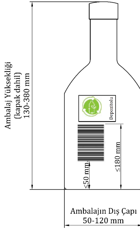
Şekil 3 — Ambalajlara ilişkin depozito logosu işaretleme örneği